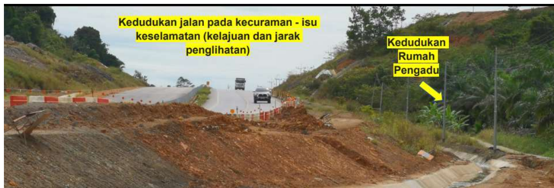
Kedudukan jalan raya utama berada pada kecerunan yang tinggi