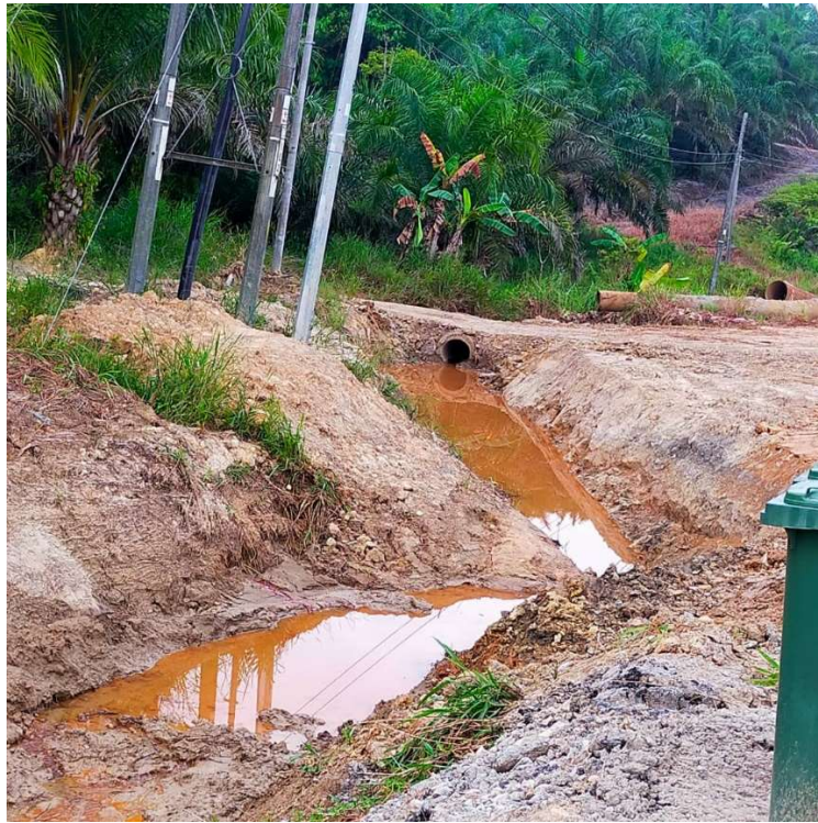
Laluan keluar masuk baru yang lebih berdekatan sedang dalam proses pembinaan