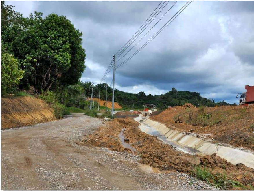
Laluan tidak berturap yang digunakan untuk keluar masuk ke jalan raya utama

berbangkit yang telah berlarutan sejak tahun 2019 dan harapan hasil penyelesaian yang telah dicapai berupaya memberi manfaat kepada penduduk kampung sekitar yang terjejas.